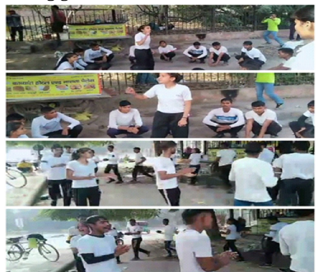
Glimpses of Nukkad Natak

In this sequence blood donation camp, and vaccination camp were also organized by NCC Naval unit to promote humanity as well as promote slogan prevention better than cure.