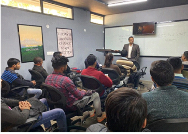
Glimpse of Ekarma center